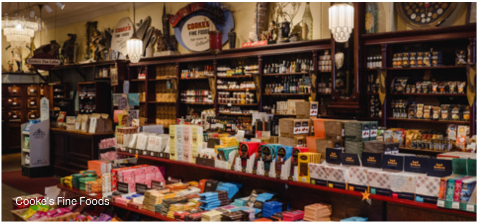
Cooke's Fine Foods