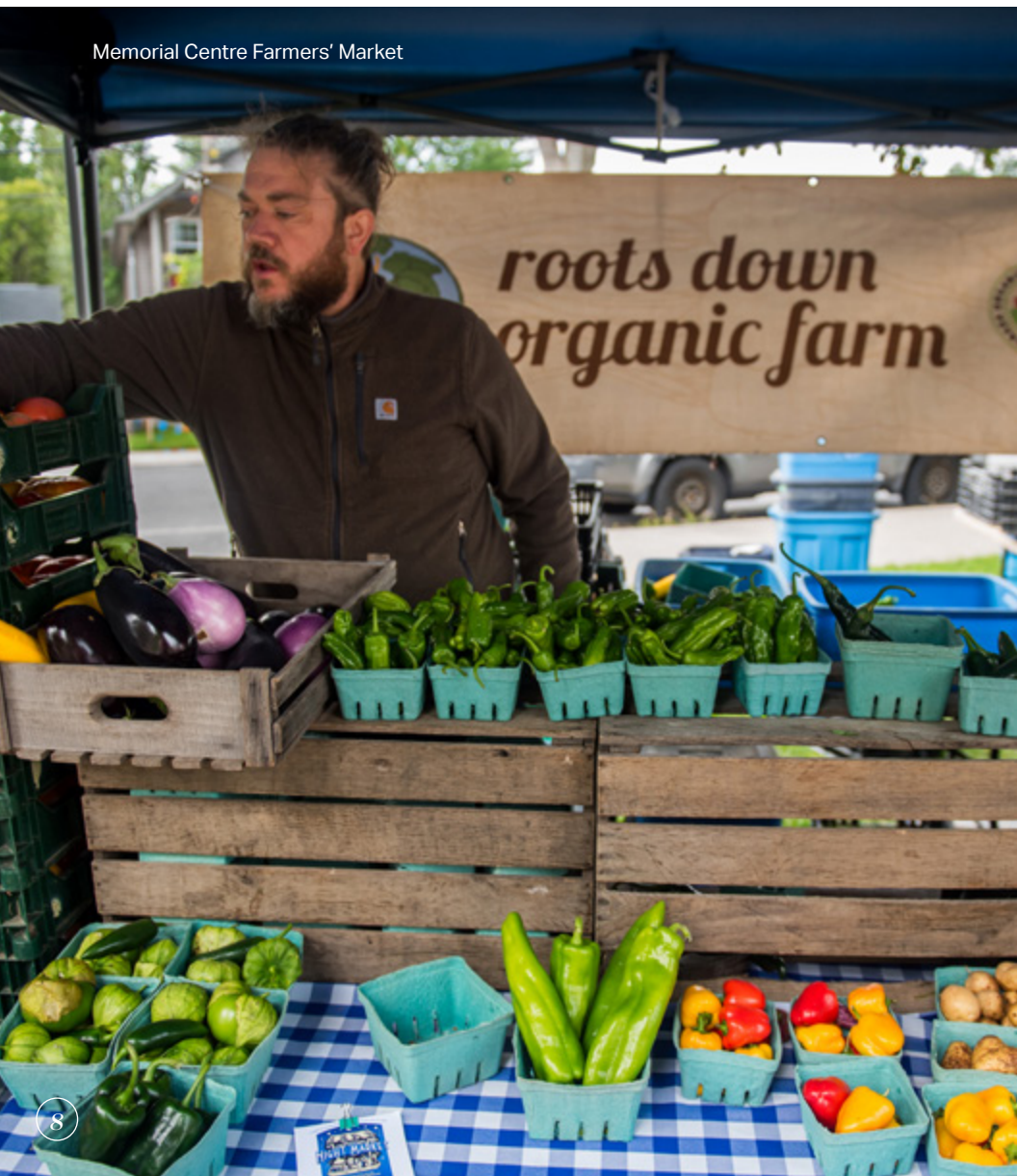
Memorial Centre Farmers' Market

Kingston est également située au cœur des terres agricoles du comté de Frontenac. Les fermes de Frontenac fournissent les tables de Kingston et les chefs de Kingston utilisent des ingrédients frais et de saison provenant de producteurs locaux.