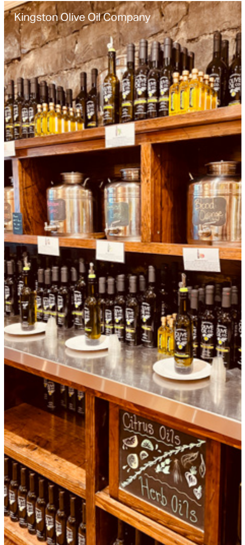
Kingston Olive Oil Company