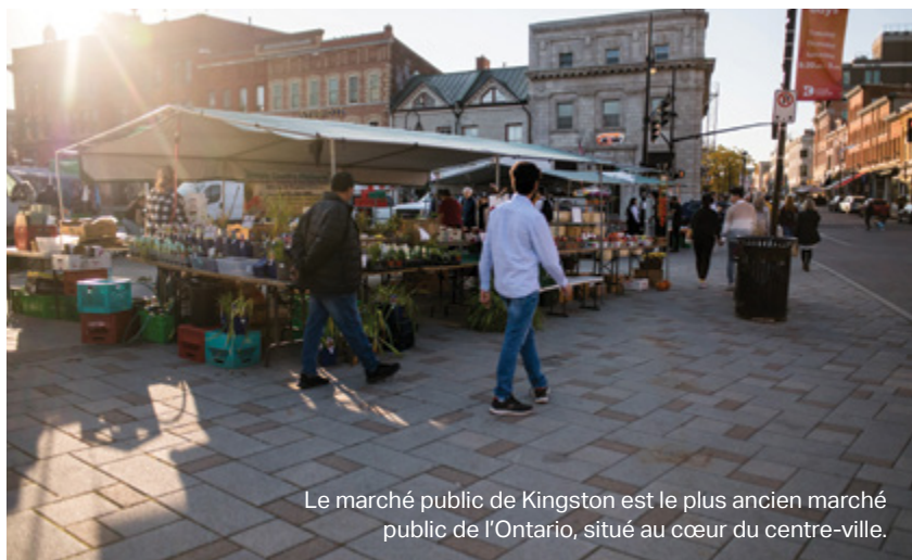
Le marché public de Kingston est le plus ancien marché public de l'Ontario, situé au cœur du centre-ville.

Découvrez ces attractions et beaucoup plus : visitekingston.ca