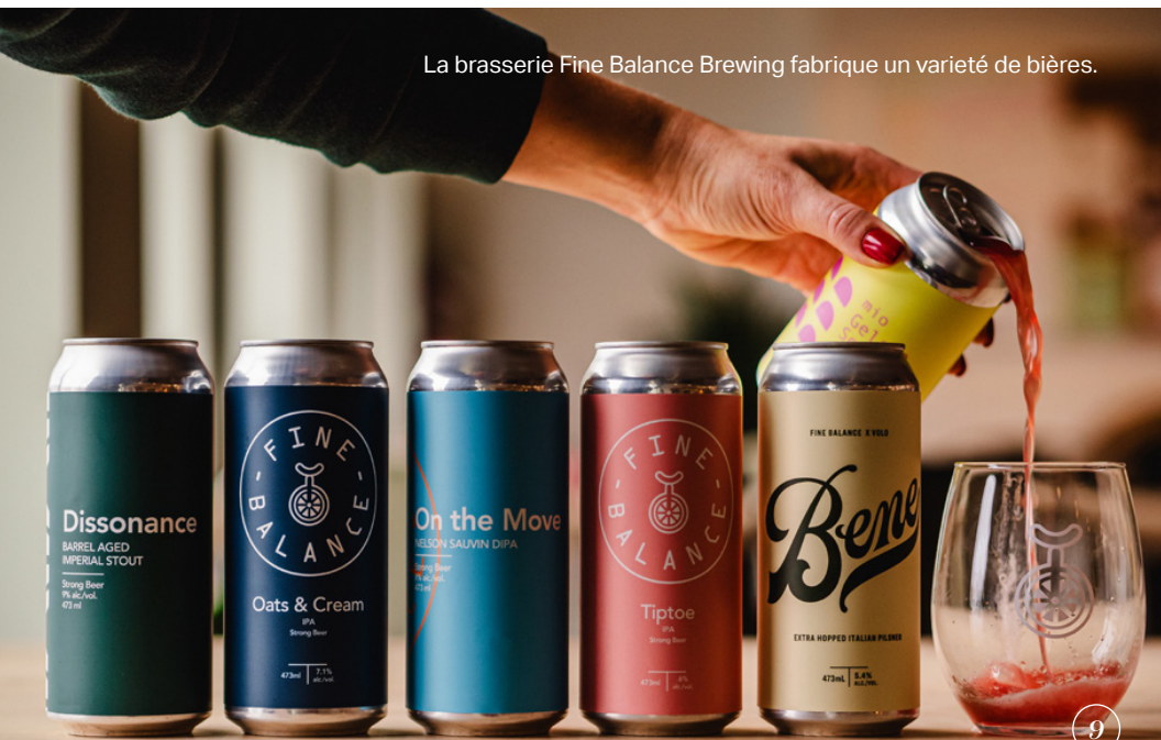
La brasserie Fine Balance Brewing fabrique un variété de bières.

Découvrez les boissons fabriquées localement : visitekingston.ca/eat-drink/wineries-breweries